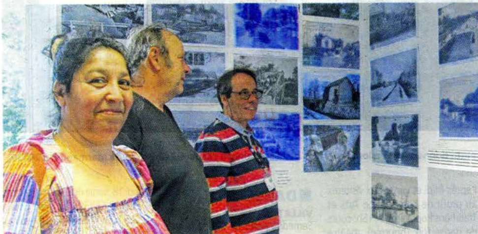
Ce marin qui habite Préchac est venu avec un bateau de location voir l'exposition sur le canal.