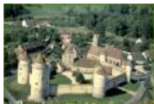
Blandy les Tours (12 Kms)

En cas de besoin, n'hésitez pas à demander l'aide d'un membre du club.