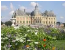
Vaux le Vicomte (12 Kms)