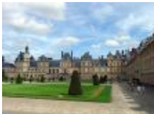
Fontainebleau 11 Kms (Possible SNCF)